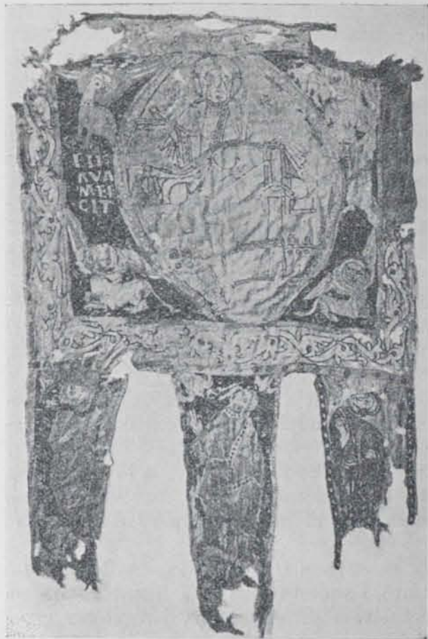
Fig. 650. — Pendó de Sant Ot

(Vexillarius Sanctæ romanæ ecclesiæ), eren portats per aquest al temple (1); banderes o pendons presos a l'enemic i portats, com a trofeu de victòria, a l'altar (2).